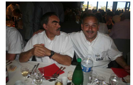
Deux bénévoles heureux

Ce fut un week-end riche en émotions, qui a montré et prouvé qu'une petite « SR » pouvait organiser un congrès digne de ce nom.