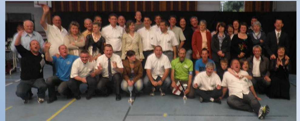
La délégation de l'Unaf 53